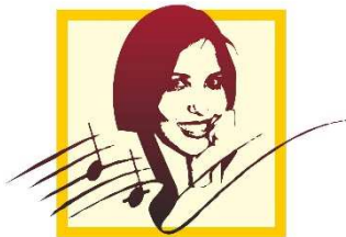
Scuola Civica di Musica Alessandra Saba